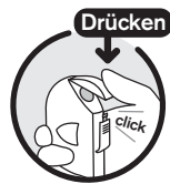
Schließen Verschlusskappe nach unten drücken

Wenn Sie in Versuchung kommen, wieder mit dem Rauchen zu beginnen